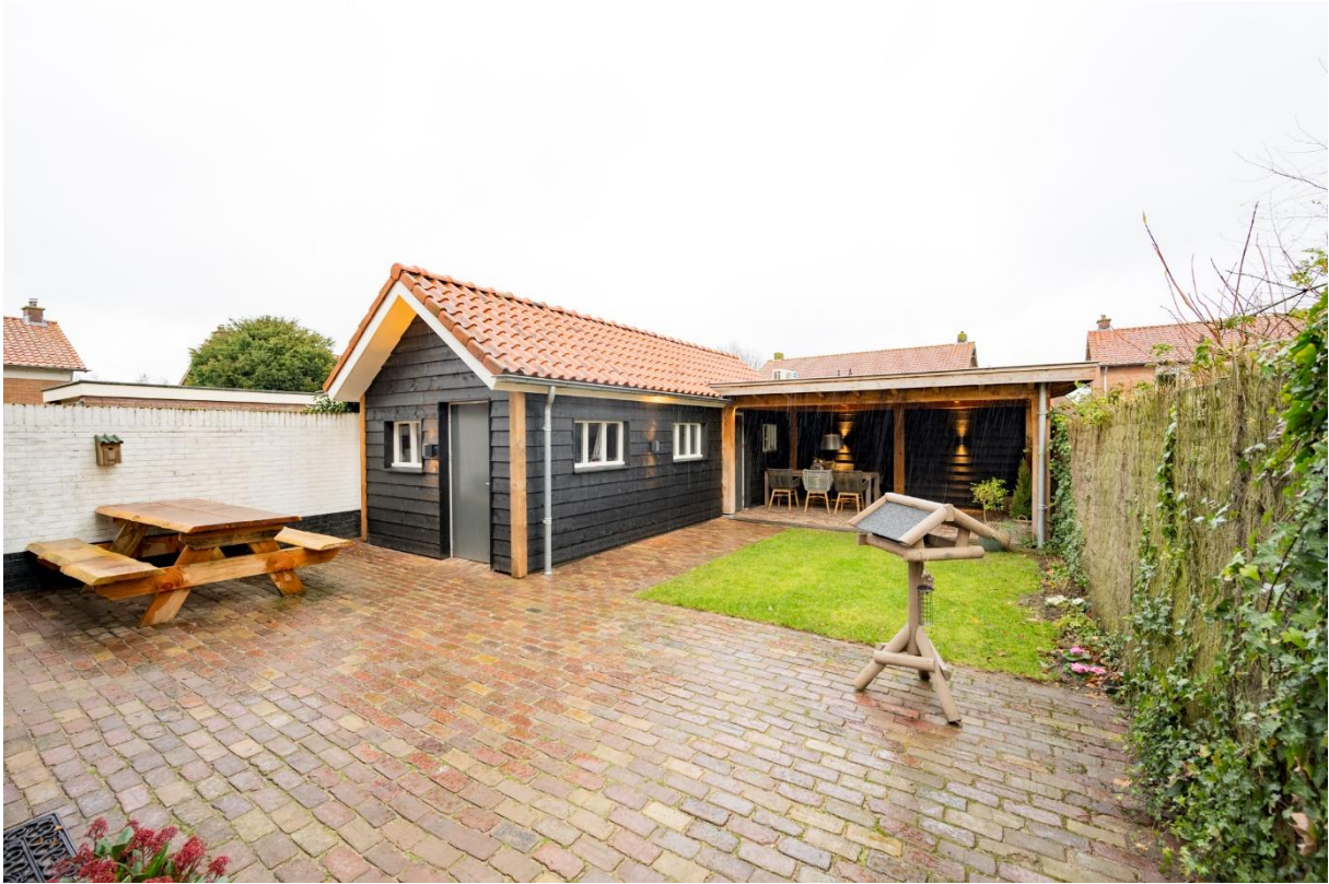
Berging, Kapsalon, Overkapping