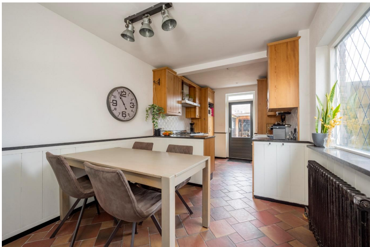
Keuken met deur naar de achtertuin met overkapping