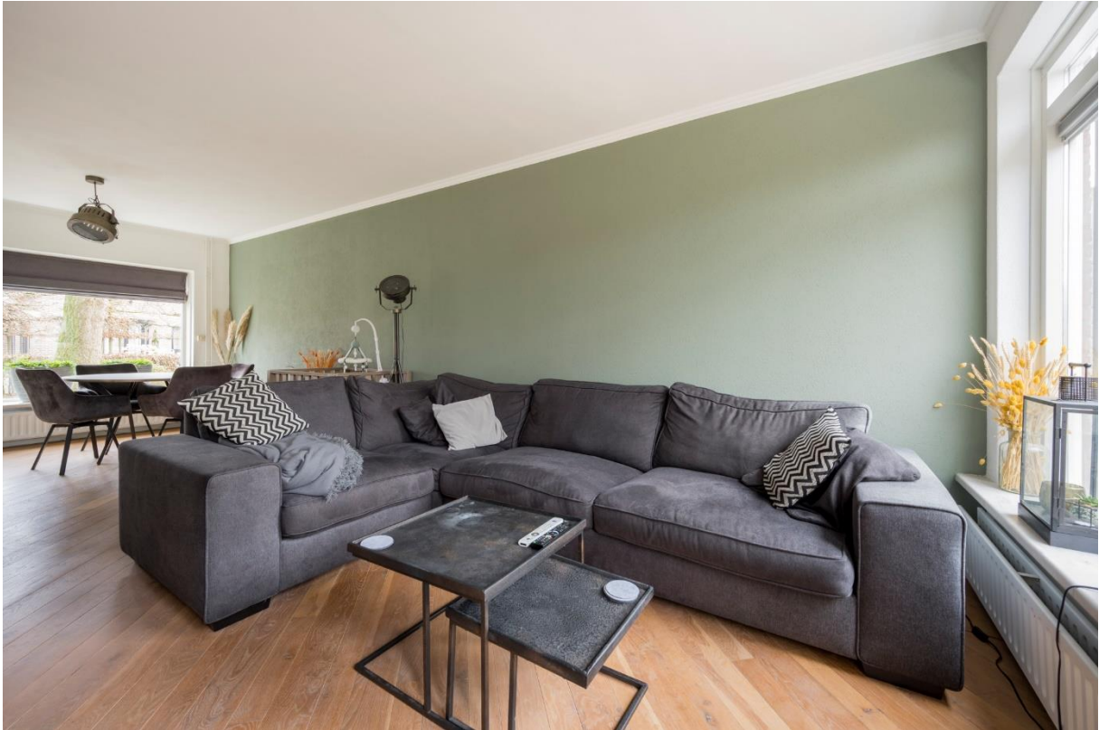
Woonkamer met openslaande deuren naar de achtertuin