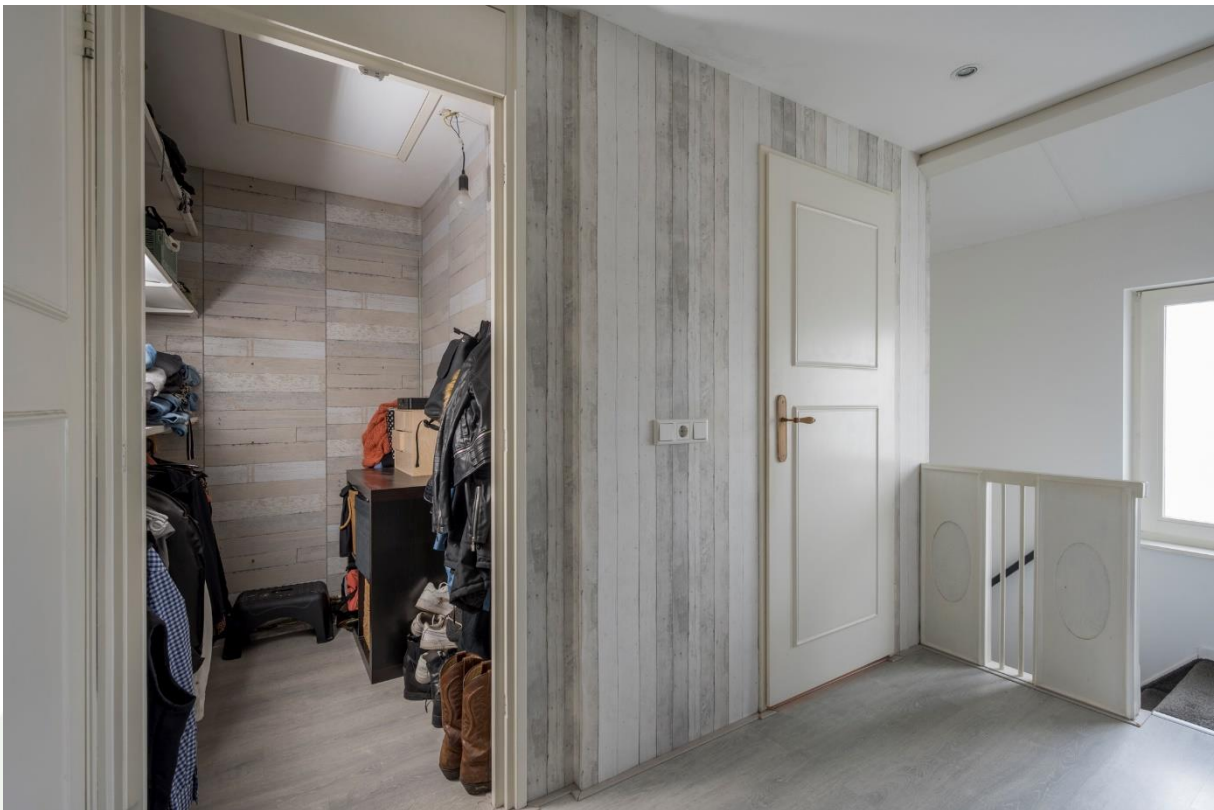
Overloop, Inloopkast met vlizotrap naar kleine berging