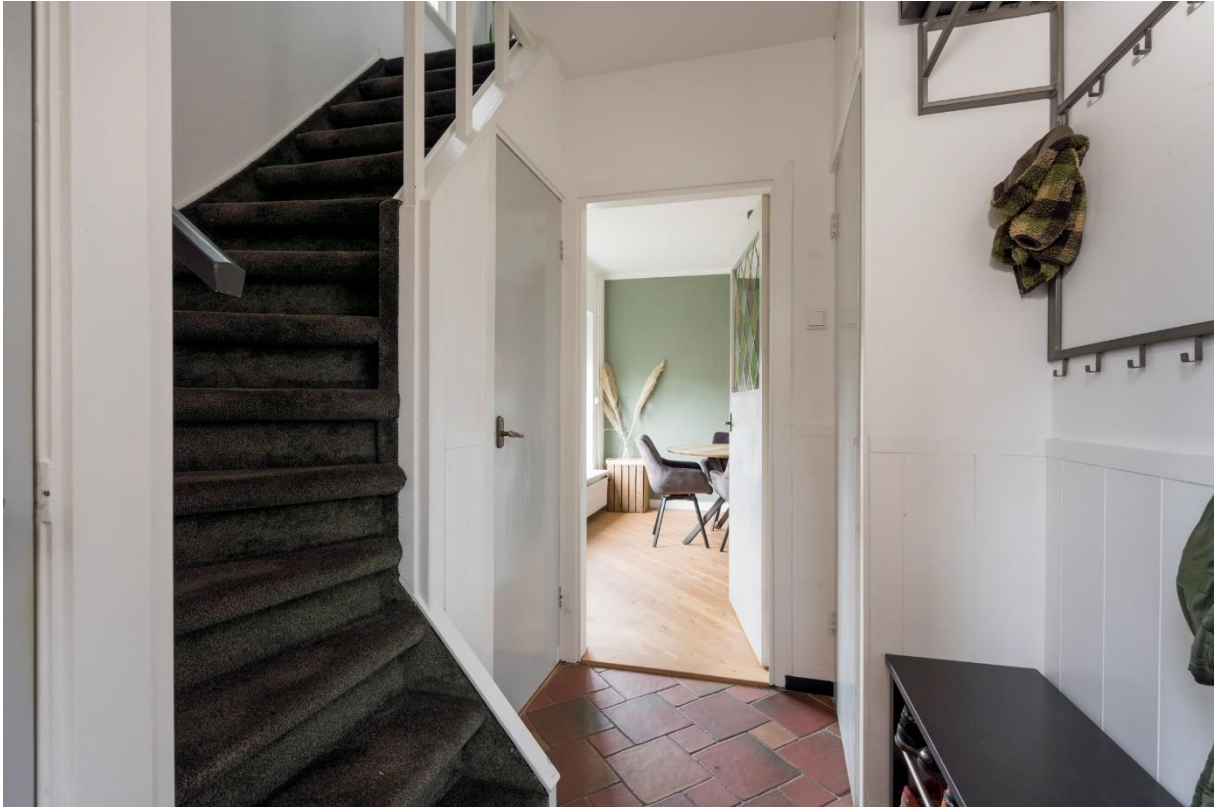
Hal met toegang tot de woonkamer